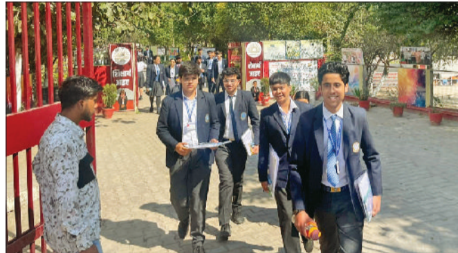
रोहतक। परीक्षा केंद्र से बाहर आते विद्यार्थी।

परीक्षा देकर केंद्र से बाहर आए विद्यार्थियों ने बताया कि भौतिकी के न्यूमेरिकल को हल करने में अधिक समय लगा जिससे अन्य सवालों के लिए भी समय कम रहता दिखा। परीक्षा