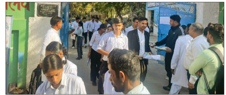
रोहतक। परीक्षा केंद्र से बाहर आते विद्यार्थी।

जिले में एचबीएसई की बुधवार को 12वीं कक्षा की अंग्रेजी विषय की परीक्षा आयोजित की गई। 45 परीक्षा केंद्रों पर 9,847 विद्यार्थियों में से 9,677 ने अंग्रेजी विषय की परीक्षा दी जबकि 170 विद्यार्थी अनुपस्थित रहे। बोर्ड की ओर से पहले परीक्षा केंद्रों की संख्या 44 तय की गई थी जिसके बाद सांपला डिवीजन में एक और परीक्षा केंद्र बनाया गया। नकल रहित परीक्षा कराने को