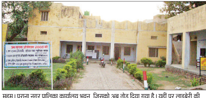
महम। पुराना नगर पालिका कार्यालय भवन, जिसको अब तोड़ दिया गया है। यहां पर लाइब्रेरी की बिल्डिंग बनेगी।

पालिका बाजार में स्थित नगर पालिका महम के पुराने कार्यालय भवन को तोड़ दिया गया है। अब यहां पर लाइब्रेरी की बिल्डिंग बनाई जाएगी। इस बिल्डिंग के निर्माण कार्य पर 4 करोड़ 15 लाख रुपए की लागत आएगी। जहां पर पुस्तकालय भवन बनाया जाएगा वहां पर कुल करीब 1194 स्क्वेयर मीटर जमीन है। जिसमें से 775 स्क्वेयर मीटर एरिया पर बिल्डिंग बनाई जाएगी। ग्राउंड फ्लोर पर वाहन पार्किंग की व्यवस्था रहेगी। प्रथम तल पर दो बड़े हॉल बनाए जाएंगे। टैयलेंट्स व बाथरूम बनाए जाएंगे। इन दो बड़े हॉल में कितानें रखने के लिए रैक बनाए जाएंगे। सभी जरूरी फर्नीचर कुर्सियां आदि की व्यवस्था की जाएगी। पुस्तकालय में 90